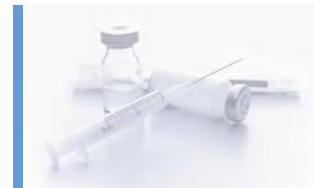
Vårdrelaterad förbrukning/ läkemedel