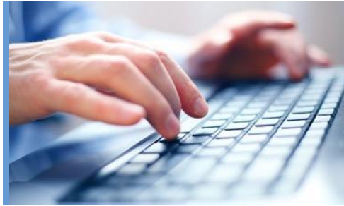
IT-produkter och tjänster