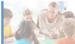
Utbildning och lärande