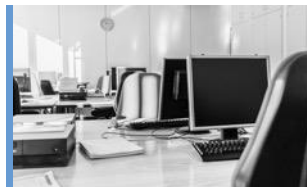
Arbetsplatser och elevdatorer