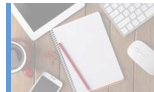
Kontor och Förbrukning