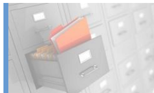
Hr och administrativa tjänster