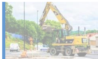
Gata och park