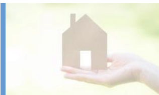
Fastighetsnära varor och tjänster