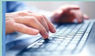
IT-produkter och tjänster