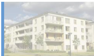
Bygg och fastighet